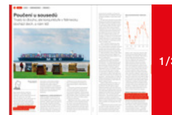
72 × 280 mm 87 000 Kč