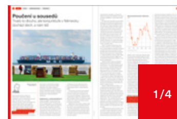
134 × 93 mm 75 000 Kč

Inzeráty zpracované na spad - se spadem nejméně 5 mm, bezpečnostní vzdálenost sazby od okraje čistého formátu je 5 mm, jinak hrozí ořiznutí. V případě dvoustrany vyžadujeme každou stranu jako samostatný dokument. Ceny uvedeny bez DPH.