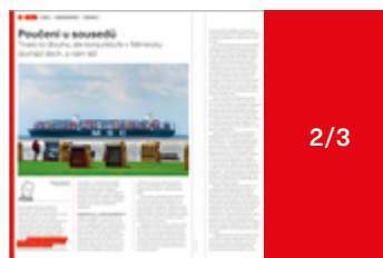
134 × 280 mm 165 000 Kč