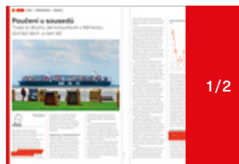
103 × 280 mm 135 000 Kč