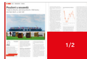
210 × 135 mm 135 000 Kč