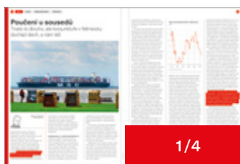
210 × 75 mm 75 000 Kč