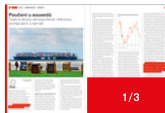
210 × 93 mm 87 000 Kč