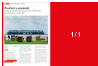
210 × 280 mm 245 000 Kč