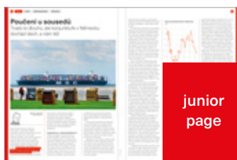
134 × 188 mm 160 000 Kč