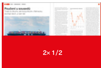
420 × 135 mm 280 000 Kč